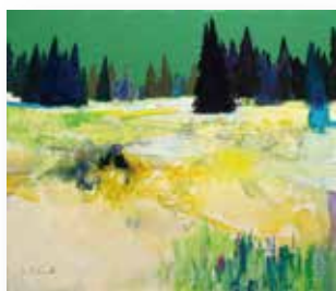
関口 雅文 「希望に溢れる光の大地へ」10号