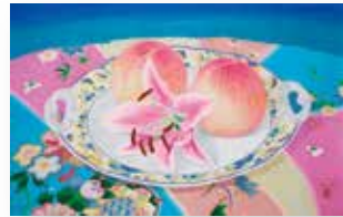
中谷 晃 「桃と百合」10号