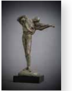
池川 直 「Adagio ゆるやかに」 H30×W21×D12cm