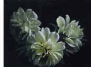
鷺 悦太郎 「黄牡丹」6号