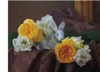
和田 直樹 「小さな花園」6号