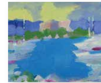
山内 大介 「アンティープ」10号