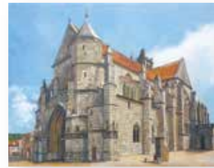
大山 富夫 「シスレーの愛した教室」6号 (制作途中)