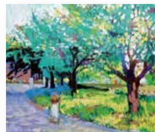
長谷川 晶子 「green」10号