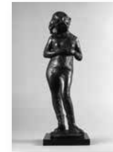
野原 昌代 「クリスマスローズ」 H43×13×11cm