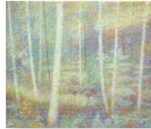
熊谷 有展 「幽邃の光景」10号