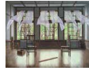
山本 桂右 「薫風」6号