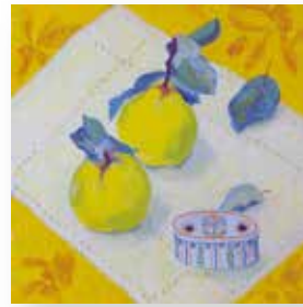
有田 巧 「マルメロとインク壺」4号