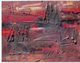
阿方 稔 「夏の終り」8号