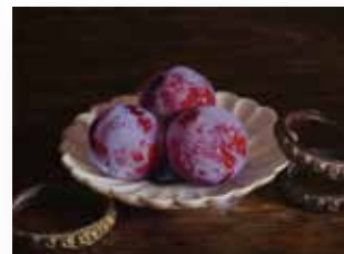
小森 隼人 「零」28.3×21cm