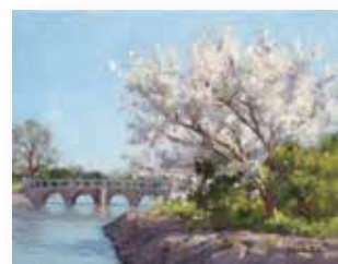
西谷 之男 「川岸の桜」6号