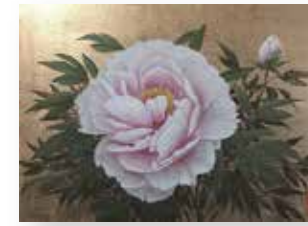
堀井 聰 「牡丹」4号