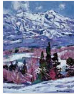
三澤 忠 「赤倉残雪」6号