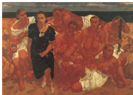
伊藤清永「海の肖像」200号変形 1937年(昭和12年)